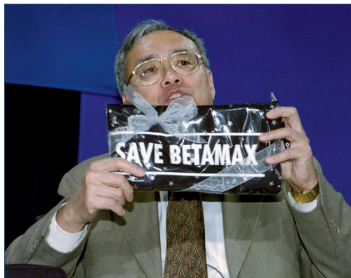
Mit Aktionen wie „Rettet Betamax“ demonstrieren auch heute noch gelegentlich Industrievertreter, dass das Recht auf private Kopien gefährdet ist.

In dem Spannungsfeld zwischen technischen Möglichkeiten und erlaubter Benutzung bewegt sich jede Form der Aufzeichnung von Videobildern, vor allem von TV-Programmen. Seit einer Richtlinie des Europaparlaments von 1999 sind die Weichen so gestellt, dass die Rechteinhaber, also meistens Filmstudios, darüber entscheiden können, ob die Aufzeichnung erlaubt ist oder nicht („Bestimmte Aspekte des Urheberrechts und der verwandten Schutzrechte in der Informa-