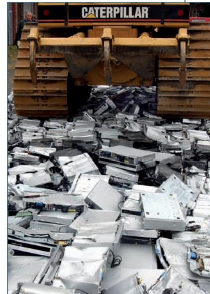
DVD-Recorder ohne Festplatte sind heute praktisch unverkäuflich und landen auf dem Müll.

Für zeitversetztes Fernsehen eignet sie sich weniger, da ist die Kombination mit einer Festplatte im Gerät besser. Dies ist, wenn es nicht ohne Neucodierung bei der Aufnahme geht, die beste Lösung. Dann spielt die begrenzte Kapazität der DVD keine so große Rolle, man kann das Material vorher exakt zurechtschneiden. Die Hoffnung, auf einer selbst aufgenommenen DVD die