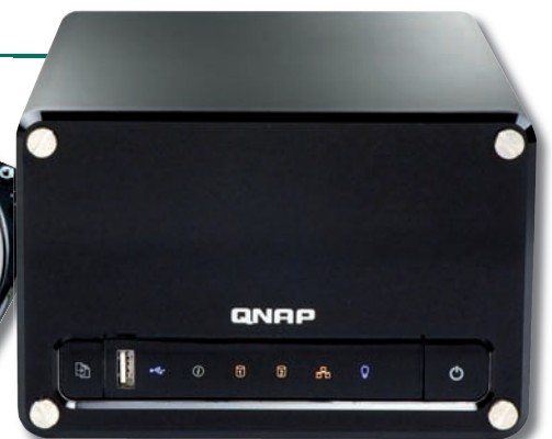
Ein Netzwerkspeicher ist nur eines von vielen Produkten, die auf eine Festplatte aufzeichnen können.

es bisher nur in Japan (iVDR-System), und fest eingebaute sind immer irgendwann voll. Dazu kommt das Ausfallrisiko, das man vom PC her kennt: Wenn die Platte crasht, ist der Inhalt meistens nicht mehr zu retten – oder nur mit viel Aufwand wiederzugewinnen.