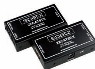
HDMI 1.3 über Dual Link CAT5 übertragen 30m mit 1080p, 50m mit 1080i