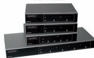
bis zu 4 Quellen auf 4 Displays schalten ! Alternativ 2X2, 2X4 und 4X2