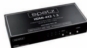
4 Quellen umschalten und auf 2 Displays anzeigen HDMI 1.3 fähig