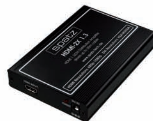
HDMI Verteiler 2 Eingänge 1.3 Eingang 30m, Ausgang 20m 1080p