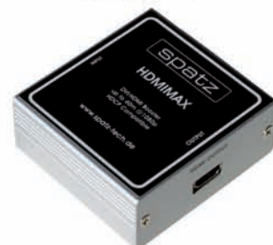
HDMI 1.3 Equalizer für bis zu 60 m bei 1080p Auflösung